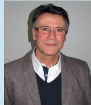
E. Le Carvenec Urbanisme Bursard